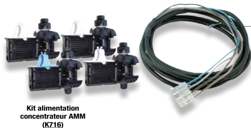
Kit alimentation concentrateur AMM (K716)